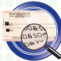
Lector de MICR