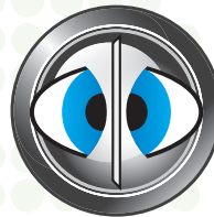
Escanea ambos lados