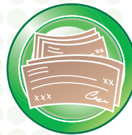
Alta velocidad de escaneo